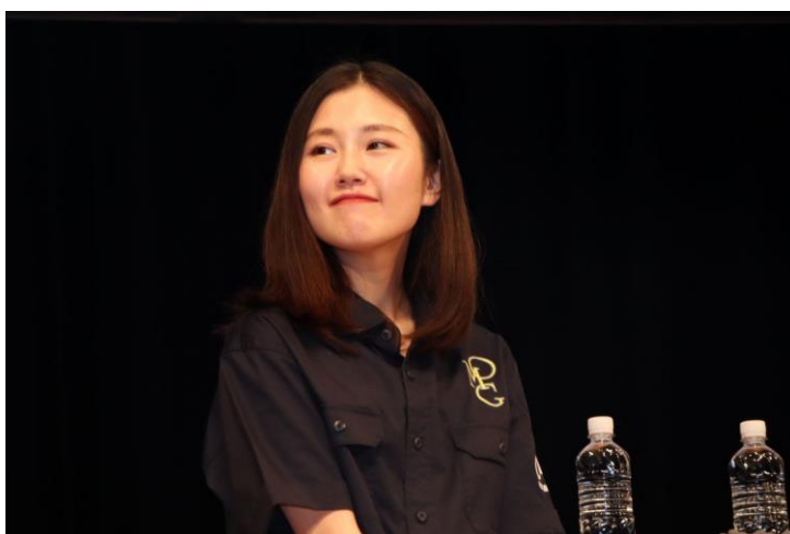
OMG (おがのモトガールズ) sizca