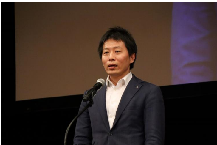
熊本県大津町 町長 金田英樹