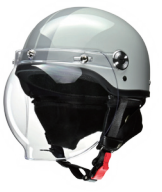
ライトグレー / グレー