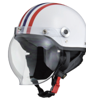
ホワイト×レッド/ブルー