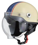
アイボリー×ネイビー