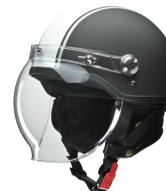
マットブラック×ホワイト