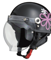
ブラック×フラワー