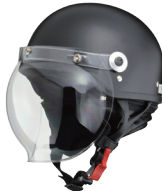
ハーフマットブラック