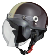
ブラウン×アイボリー