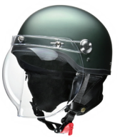
マットグリーンメタリック