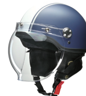
マットネイビー×ホワイト