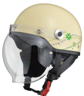
クラブアイボリー