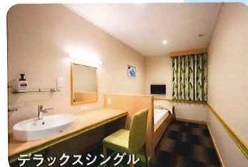
デラックスシングル