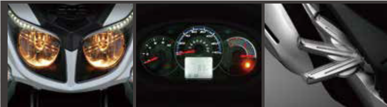
LED ポジションライト