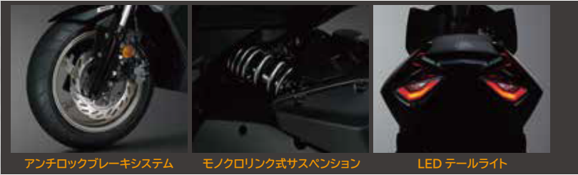
アンチロックブレーキシステム